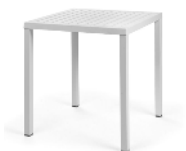
BIANCO vern. bianco 47853.00.000

PT Mesa empilhável 70x70 cm. Tampo DurelTOP em polipropileno com tratamento anti-UV colorido na totalidade. Pernas em alumínio pintado. Acabamento fosco. Pés ajustáveis. Resina reciclável.