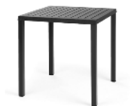
ANTRACITE vern. antracite 47852.02.000