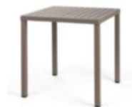
TORTORA vern. tortora 47859.10.000