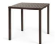
CAFFÈ vern. caffè 47857.05.000